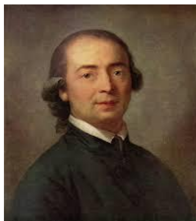
Johann Gottfried Herder

Bu davrda qator g'arb davlatlari miqyosida tarixshunoslikka nazar tashlasak, quyidagicha xulosa qilish mumkin: