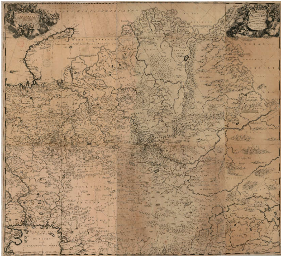
Рис. 1. Николаас Витсен. Новая географическая карта Северной и Восточной части Азии и Европы, простирающаяся от Новой Земли до Китая. Амстердам, 1687.

К статье Ш. С. Камолидина «Николаас Витсен о племенах и народах Средней Азии»