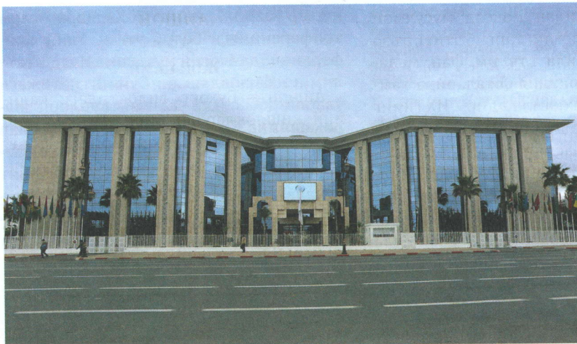
Работ ш.даги ICESCO бош қароргоҳи

Низоми ишлаб чиқилди. Ушбу низоми 4 боб, 22 моддадан иборат.