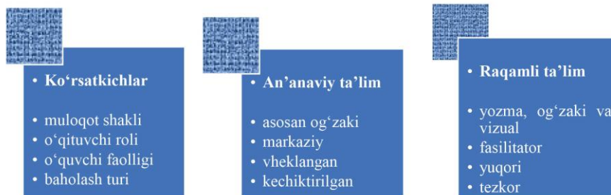
1-jadval. An'anaviy va raqamli ta'lim muhitida pedagogik diskurs xususiyatlari

Tadqiqotda sifat va miqdoriy yondashuvlar uyg'unligidan foydalanildi. Ma'lumotlar an'anaviy sinf mashg'ulotlari va raqamli platformalarda olib borilgan darslarni kuzatish orqali to'plandi. Shuningdek, diskursiv tahlil, qiyosiy tahlil va tavsifiy metodlar asosida pedagogik muloqot namunalari lingvistik va pragmatik jihatlarini o'rganildi.